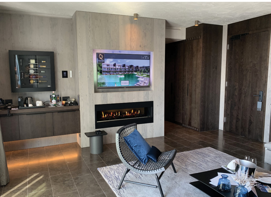
Le Suite (225 m 2 ) sono sviluppate su due piani, con terrazza sul tetto, piscina, idromassaggio e sauna. Il controllo degli impianti avviene tramite il KX3 e iPad.

agli amplificatori dislocati nei vari ambienti. Il controllo dell'impianto è affidato alle centraline RTI, cuore nevralgico della progettazione, dispositivi che rendono semplice quanto di più complesso e articolato sia presente in una installazione di questo tipo". A visitare Quellenhof Luxury Resort ci si mette un po', ma a ripercorre tutti gli ambienti ci si rende conto di quanto sia minuziosa la cura con la quale è stata portata avanti la progettazione. "Superato lo studio e la predisposizione dell'impianto, unitamente all'instradamento dei flussi, anche la scelta dei diffusori ha avuto la sua importanza – ci racconta dal canto suo Maurizio Bellisi, Channel Manager di COMM-TEC Italia. La maggior parte degli altoparlanti presenti nella struttura sono targati Origin Acoustics, una scelta che ci ha consentito di diffondere l'audio in tutte le zone, anche quelle che per natura richiedono una tecnologia adeguata