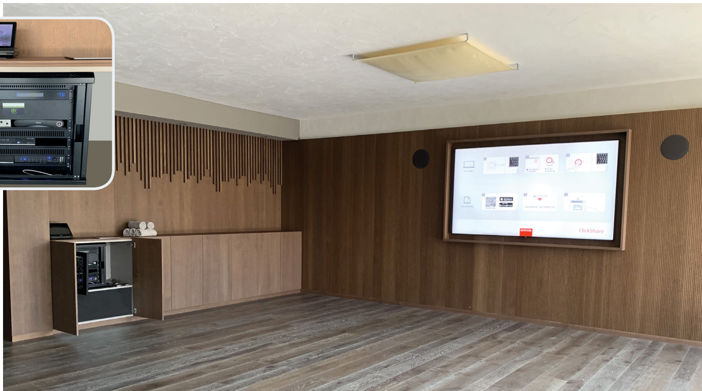
Sala Conference, nel rack sono presenti: Barco Clickshare CSE-200, centralina RTI XP-6S, switch Luxul AMS-2624P, touchpanel RTI CX10